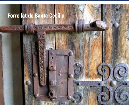
Forrellat de Santa Cecília