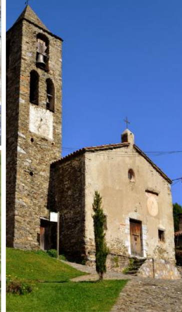
Església de la M.D. de les Neus d'Espinavell